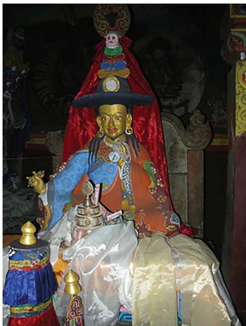
1. sNgags 'chang Shākya bZang po szobra Tsiri templomában.