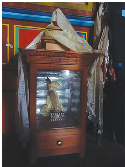
2. A borókafából készült phur ba Tsiri templomában (A szerző fotója, 2012. április)