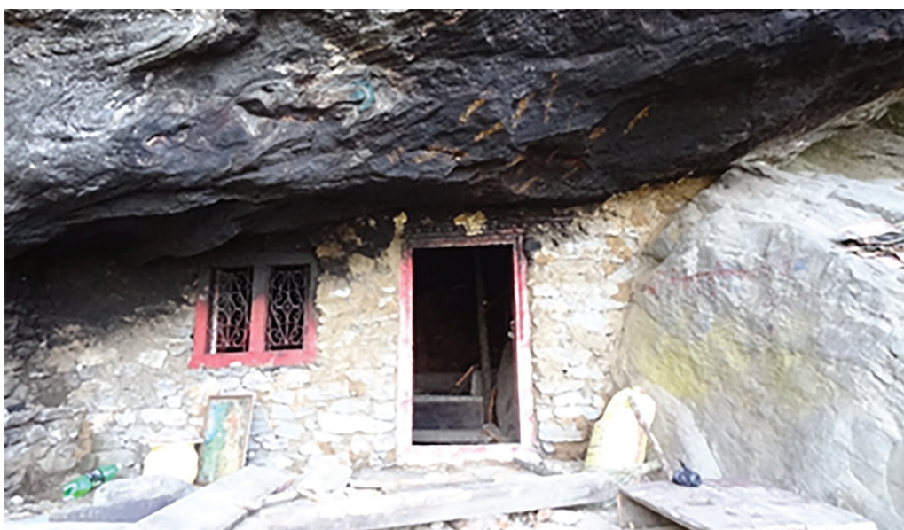
4. A Lung bstan phug, azaz a Prófécia barlangja, ahol a sNgags 'chang Shākya bZang po meditált. (A szerző fotója, 2012. április)